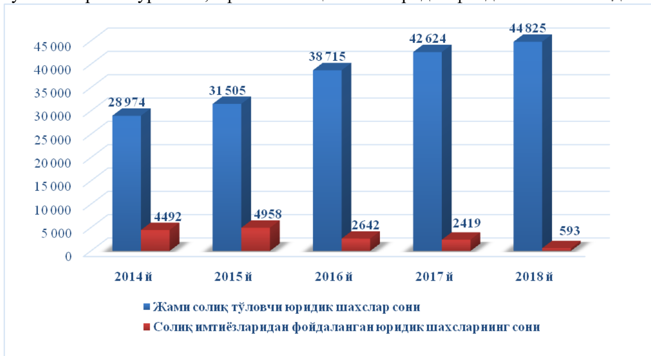
2-расм. Самарқанд вилояти бўйича солиқ имтиёзларидан фойдаланаётган юридик шахслар 9

Вилоятда мавжуд бўлган жами хўжалик юритувчи субъектлар ёки солиқ тўловчиларнинг ўртача 9,2 фоизи солиқ имтиёзларидан фойдаланиб келмоқда.